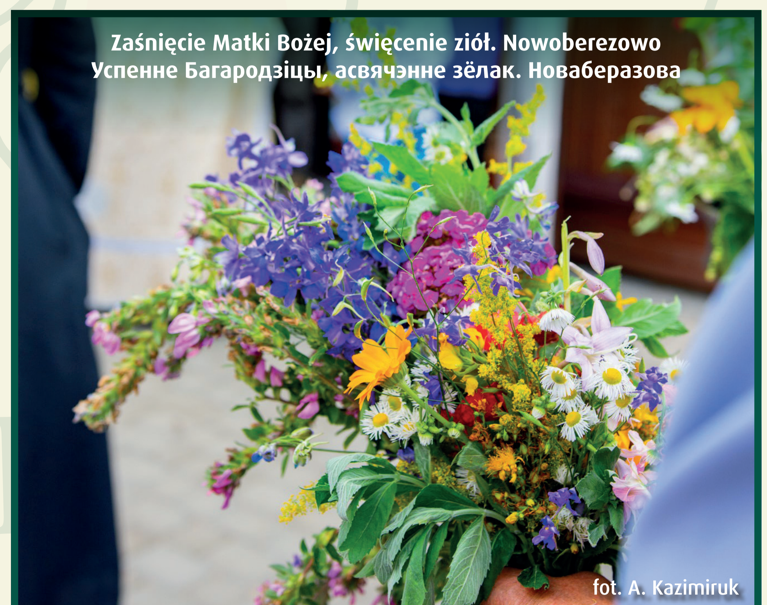
Zaśnięcie Matki Bożej, święcenie ziół. Nowoberezowo Успенне Багародзіцы, асвятчэнне зёлак. Новаберазова