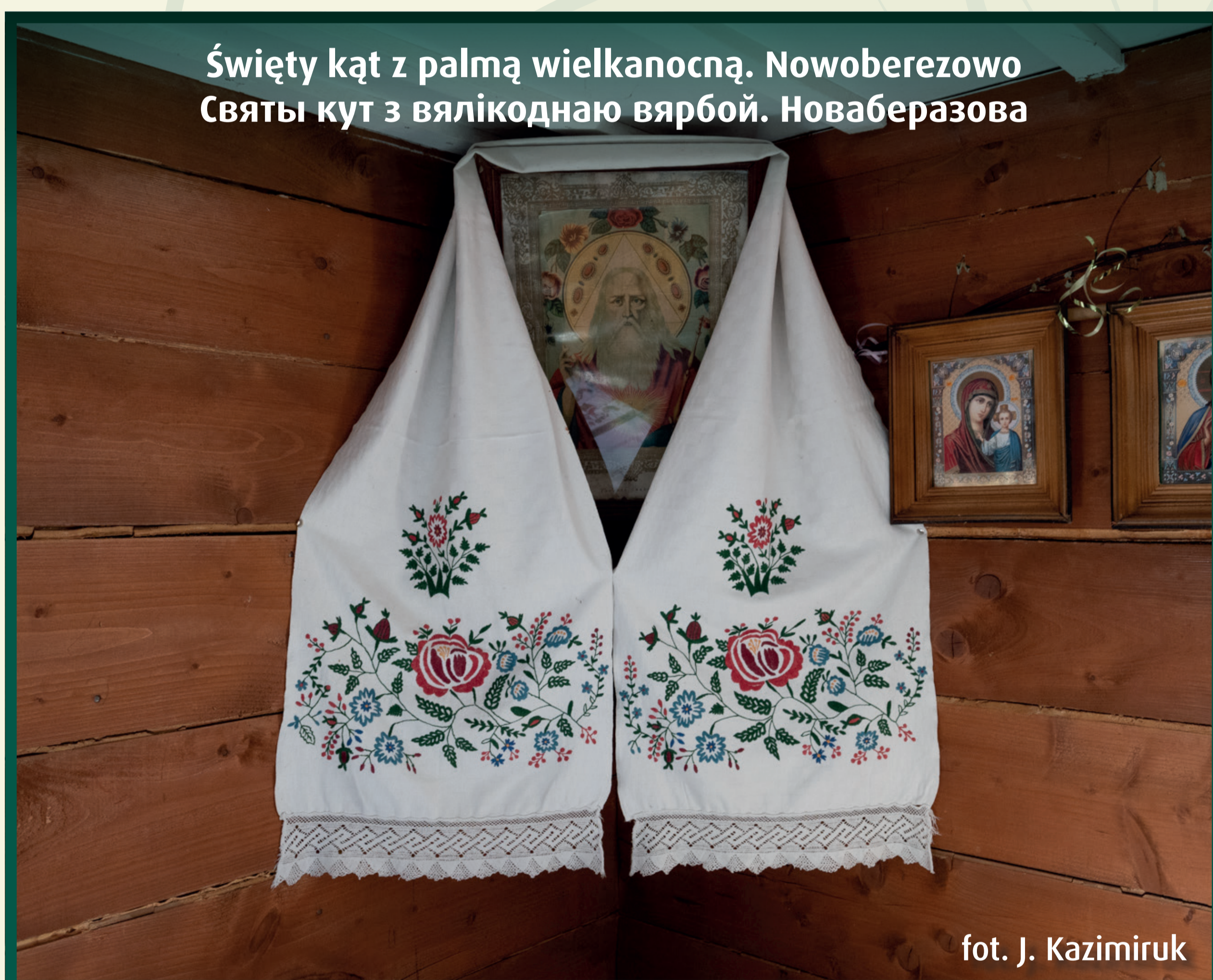
Święty kąt z palmą wielkanocną. Nowoberezowo Святы кут з вялікоднаю вярбай. Новаберазова

Starajmy się poznać, pielęgnować i zachować tradycje kulturowe naszego regionu dla kolejnych pokoleń.