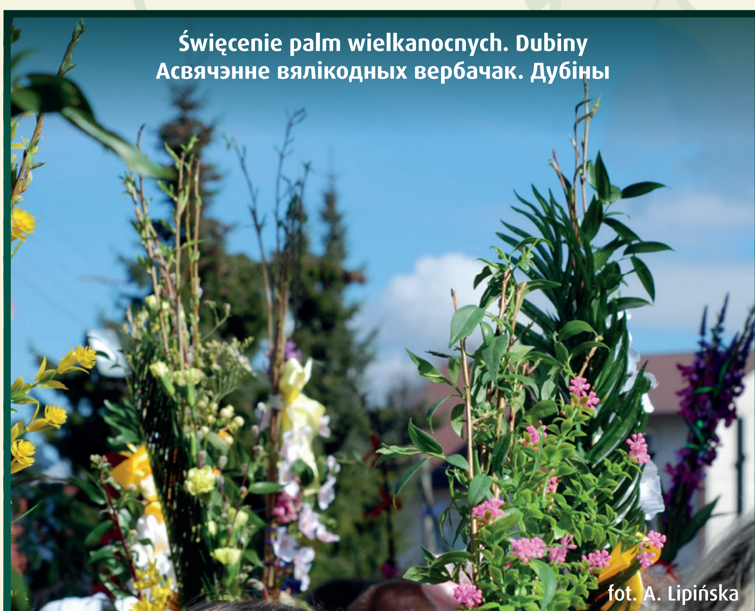
Święcenie palm wielkanocnych. Dubiny Асвятчэнне вялікодных вербачак. Дубіны