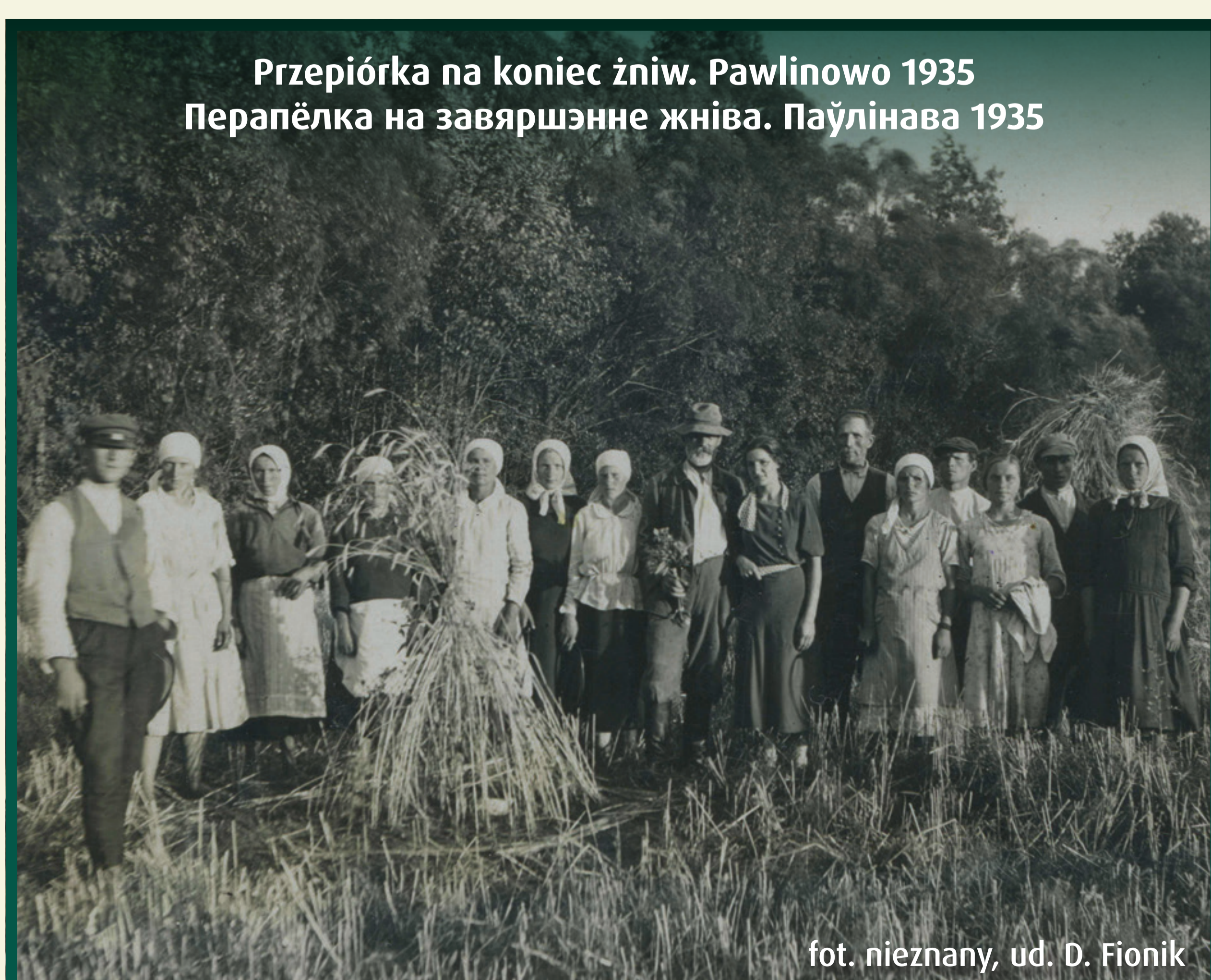
Przepiórka na koniec żniw. Pawlinowo 1935 Перапёлка на завяршэнне жніва. Паўлінава 1935