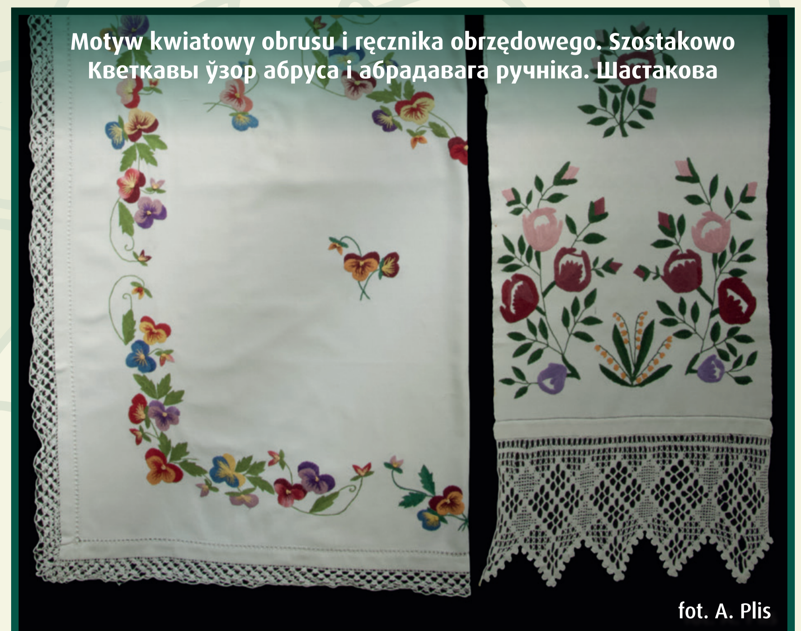
Motyw kwiatowy obrusu i ręcznika obrzędowego. Szostakowo Кветкавы ўзор абруса і абрадавага ручніка. Шостакова