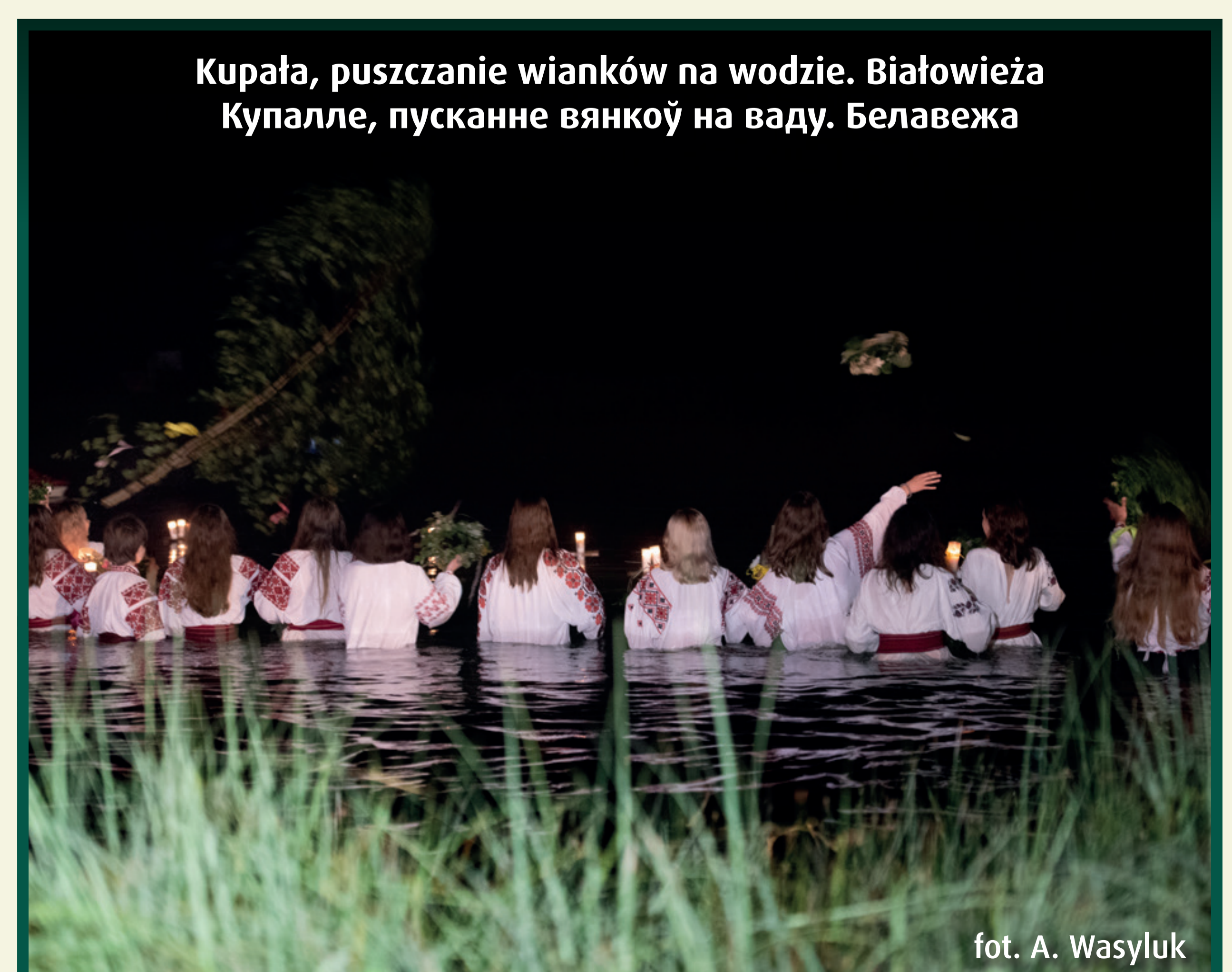
Kupała, puszczanie wianków na wodzie. Białowieża Купалле, пусканне вяноў на ваду. Белавежа